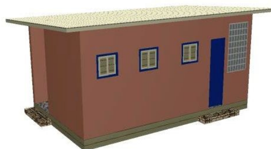
Figure 2-b : Façade arrière du bloc de toilettes