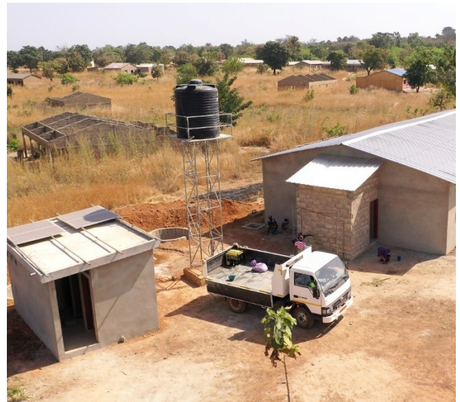
Château d'eau en construction