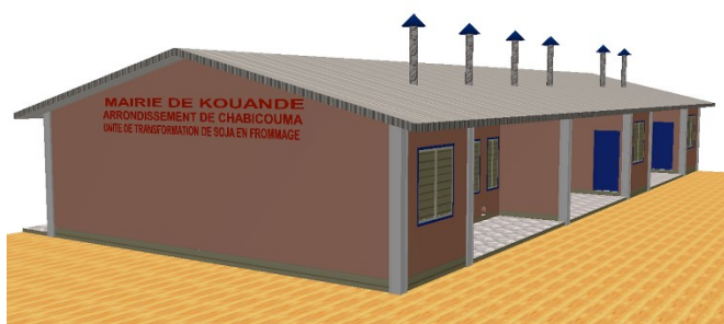
Figure 1-b : Façade arrière de l'unité