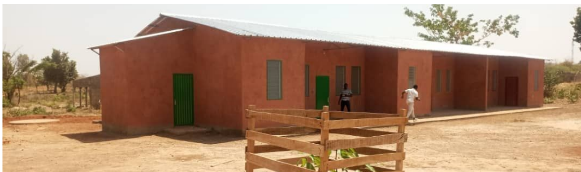
Unité de Chabi Couma en février 2023