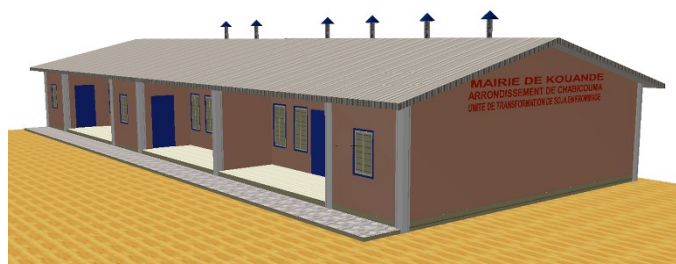
Figure 1-a : Façade principale de l'unité